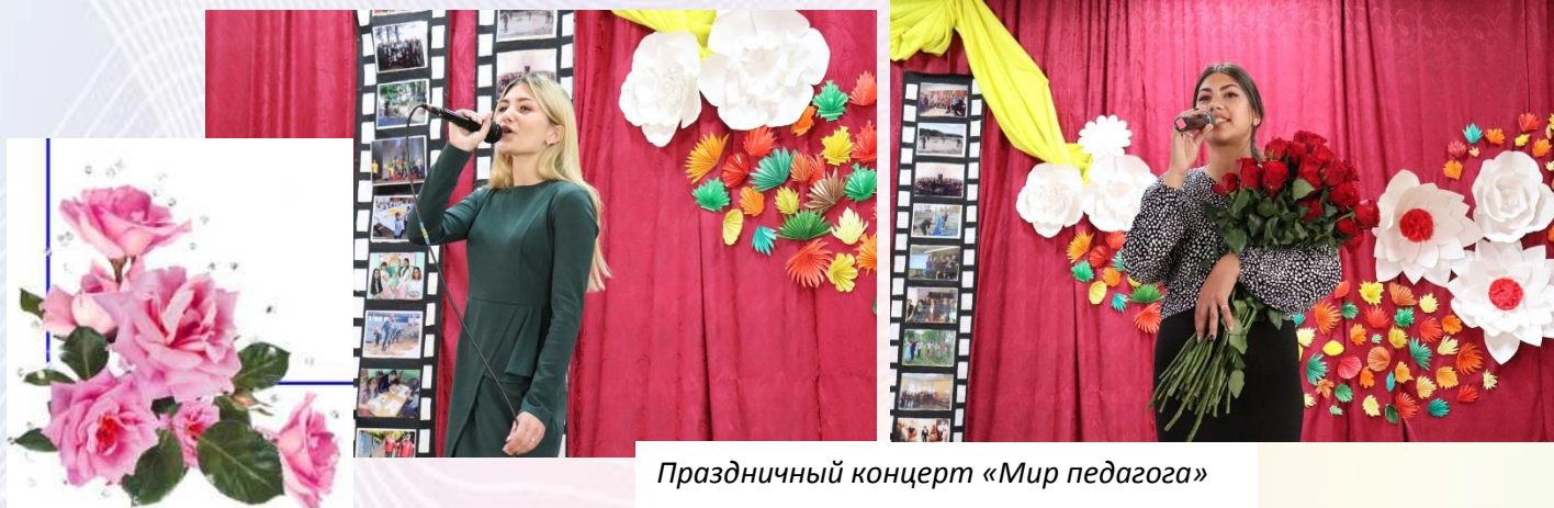
Праздничный концерт «Мир педагога»

С уважением Красовская Августина, учащаяся группы ФК-2016